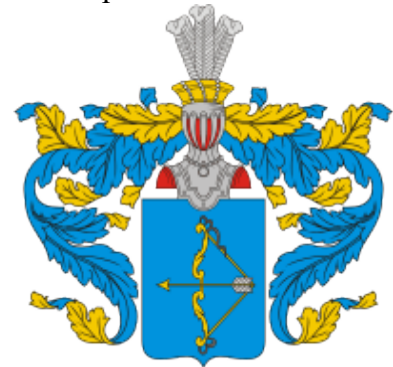
Герб рода барона Аракчиева

Герб – это особый отличительный знак. Он выделяет личность из толпы и обозначает ее владения. И в то же время, герб рода объединяет людей. Сквозь расстояния и время.