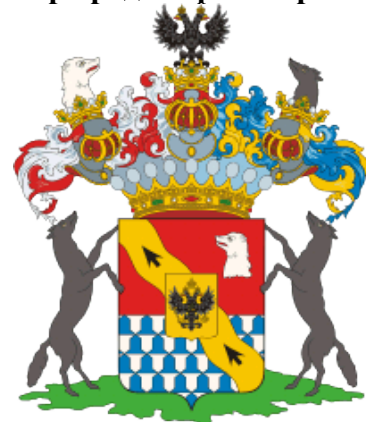
Герб рода графов Румянцевых

Немецкое слово «герб» - «Herbe» - означает «наследство». В Средние века он передавался из поколения в поколение как рисунок на щите.